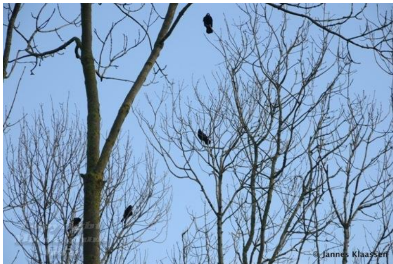
Foto: De roekenkolonie nabij Boerdam. De bomen zijn nu nog leeg en kaal. Over een paar maanden zullen hier weer de nodige nesten worden gebouwd door ijverige Roeken. Deze kolonie is een behoorlijk aantal jaren geleden ontstaan toen nesten vanuit het centrum van Middelstum hier naar werden verplaatst.

De gemeente Loppersum (één roek per twintig inwoners) pakt de kraai-achtigen met megafoons en laserpennen aan. Volgens de gemeente is vooral het lawaai dat deze kraaiachtigen maken 'een ergernis van veel inwoners'. Roeken zijn naar menselijke maatstaven een van de slimste vogelsoorten. Zoals alle kraaiachtigen kunnen ze rekensommen oplossen en als groepsdieren houden ze er uitgebreide sociale vaardigheden op na, inclusief een rijke woordenschat. En dat gepraat ergert de blijkbaar op stilte gestelde Loppers mateloos. "Mensen vinden de overlast met name vervelend op begraafplaatsen en bij monumenten", zegt een gemeentewoordvoerder. "Naast geluidshinder is er ook sprake van grote hoeveelheden uitwerpselen."