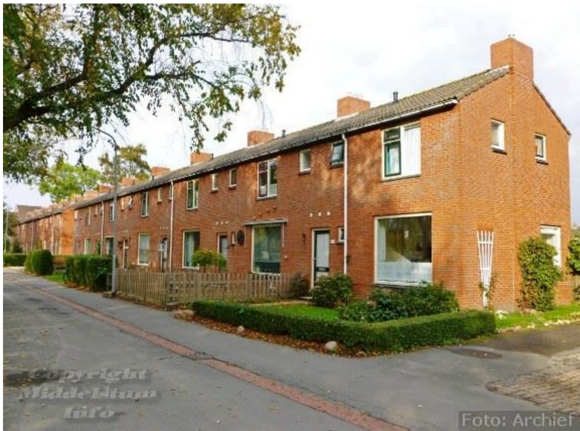
De woningen aan de Zuiderstraat in Middelstum die ook gesloopt gaan worden.

Wierden en Borgen heeft er recent, op nadrukkelijk verzoek van de bewoners, in overleg met NAM en de gemeente Loppersum voor gekozen om 38 woningen aan de Badweg, Duursumerweg, Pomonaweg en Verbindingsweg in Loppersum uit de versterkingspilot te halen en bij deze woningen over te gaan tot sloop en vervangende nieuwbouw.