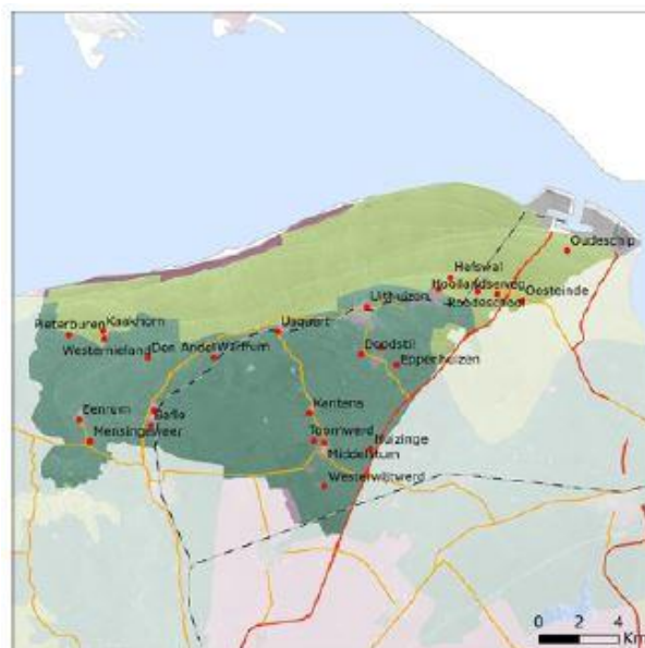
Kaart van het Hoogeland

Yme Arends: Het is niet te hopen dat middelstum bij Delfzijl en Appingedam komt we hebben daar niks te zoeken we zijn verbonden met het hoogeland.