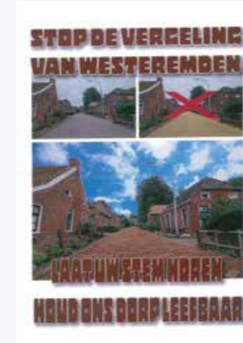
Affiche actiecomité Westeremden