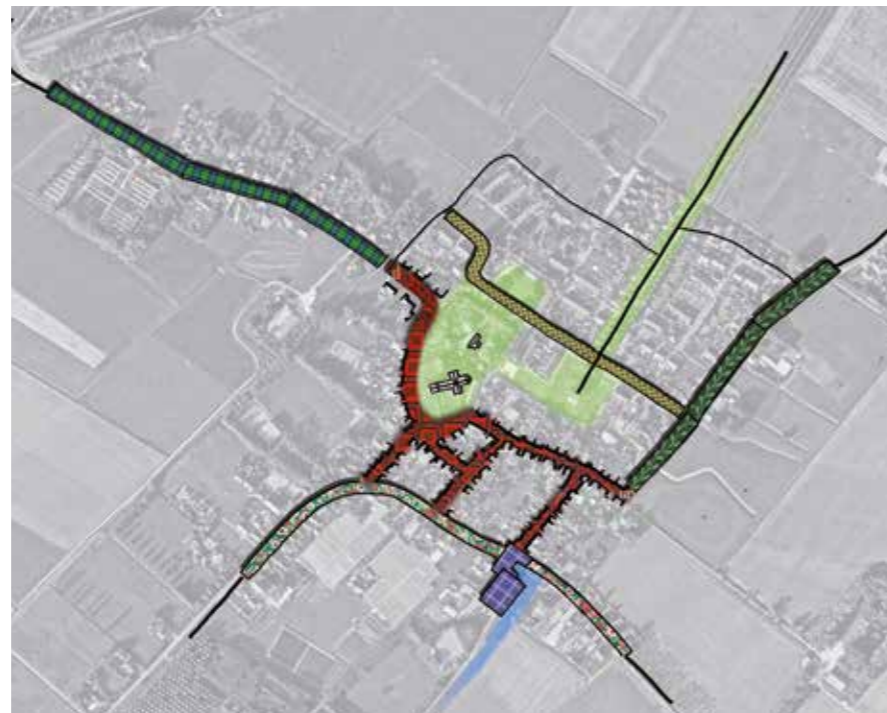
Ruimtelijk concept Stedum

“Hoewel in elk dorp dezelfde werkwijze werd gevolgd, was elk proces anders. Dat had te maken met de inhoud van het plan en de aard en identiteit van het dorp. Het ene dorp was meegaand, het andere dorp kritisch of initiatiefrijk. Elk dorp was zeer betrokken en de inwoners toonden begrip voor de overlast van de werkzaamheden.”