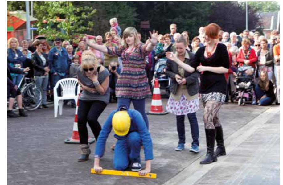
Loppersum Molenweg opening

“Van te voren de spelregels van de klankbordgroep duidelijker bekend maken zodat daar geen discussie over komt.”