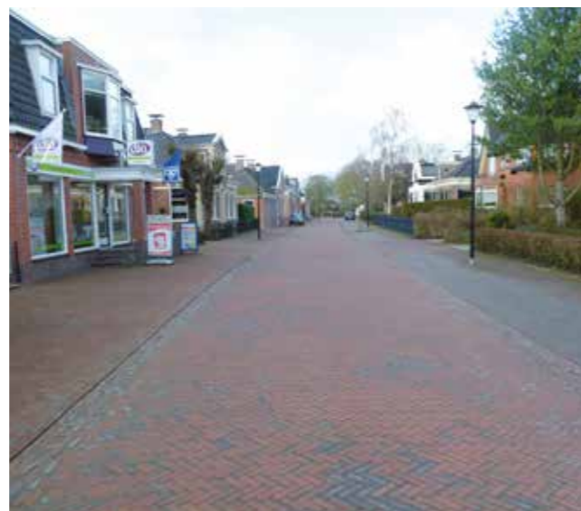
Middelstum Grachtstraat nieuw