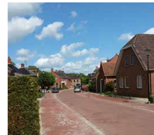
Middelstum Oude Schoolsterweg