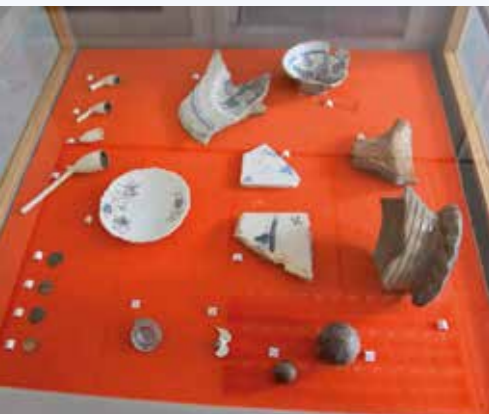
Archeologische vondsten Middelstum

In Middelstum wilden de bewoners van de Grachtstraat geen klinkers in verband met te verwachten trillingen; er was voorkeur voor asfalt. Dat terwijl het gebruiken van gebakken materiaal een uitgangspunt was voor het ontwerp. Er zijn veel overlegsessies geweest over de technische aanpak van de inrichting van de straat en de beeldkwaliteit. Met voorzieningen om het zwaardere verkeer om te leiden en een maximumsnelheid van 30 kilometer per uur, vonden de inwoners en de gemeente elkaar. Les: luisteren en waar dat kan tegemoet komen.