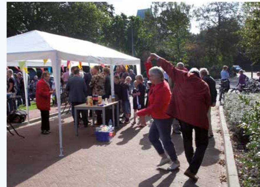
Loppersum Molenweg opening