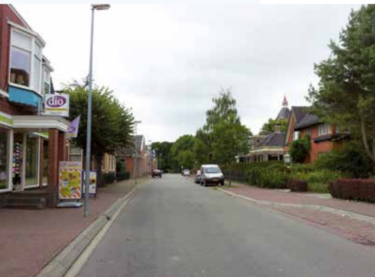
Middelstum Grachtstraat oud

Parallel aan het herinrichten van de dorpen zijn in totaal tien bruggen gerenoveerd of vernieuwd. Acht gemeentelijke begraafplaatsen zijn opnieuw ingericht. Alle gemeentelijke watergangen in de bebouwde kom zijn gebaggerd. Tevens zijn beschoeiingen vernieuwd of vervangen. Een grootschalig verlichtingsplan is uitgevoerd voor alle dorpen. Doorgaande wegen buiten de bebouwde kom zijn verbeterd en voorzien van bermbeton.