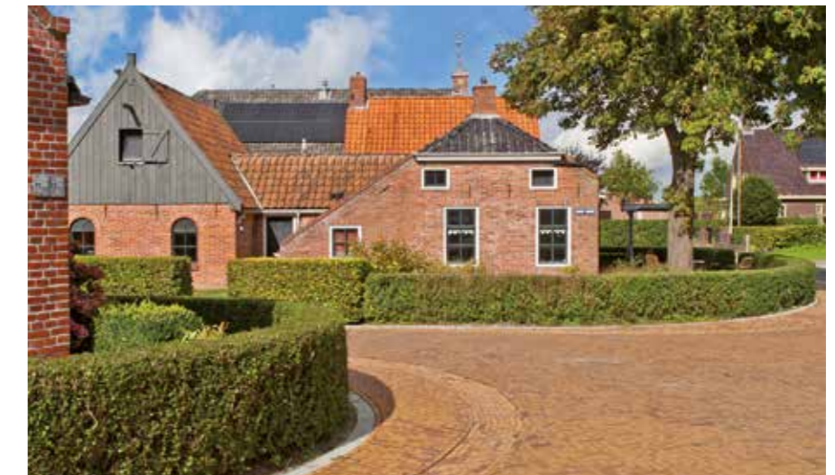
Westeremden Oude Boor

Inmiddels is de herinrichting gereed en zijn de reacties van de inwoners overwegend positief over het uiteindelijke beeld. Les: je kunt niet altijd iedereen tevreden krijgen en op zo'n moment moet je er als bestuur zijn. Dan maak je een keuze en moet je daarvoor staan.