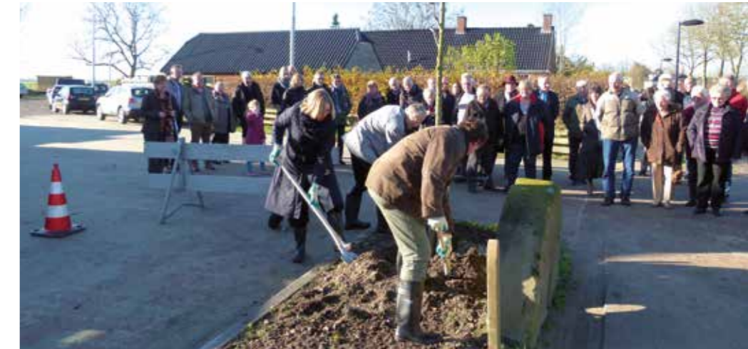
Garrelsweer feestelijke afsluiting

Het opzetten en doorlopen van dit proces vraagt intensieve communicatie. De uitgangspunten komen overeen met de spelregels in de Participatiewijzer van de Nationale Ombudsman ( www.nationaleombudsman.nl ). Vooral in de beginfase is het een flinke investering gericht op informeren en er bij betrekken, overleggen en reageren. Gaandeweg ontstond in de dorpen betrokkenheid bij het project. Dat bleek uit hoge opkomsten tijdens bijeenkomsten en veel individuele reacties en ideeën.