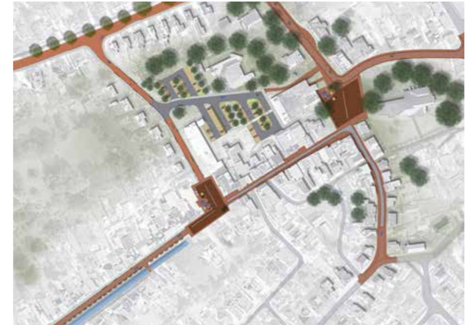
Planontwerp Loppersum Centrum

“Het is sterk om de projecten te evalueren en daadwerkelijk onderdelen te herstellen als blijkt dat iets niet werkt in de praktijk.”